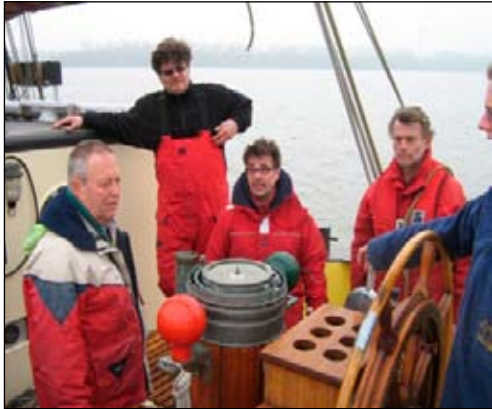
hoe ga je het doen?