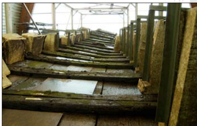
het romeinse schip

Na koffie en voor sommigen een lunchhapje, togen we tegen twee uur naar het gebouw van de RACM, dat naast het Bataviaterrein gelegen is.