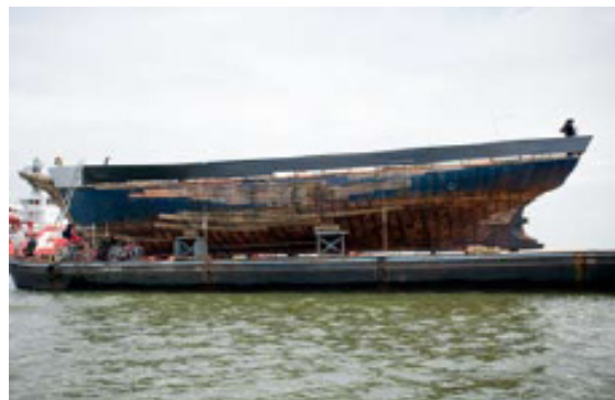
de Tres Hombres op ponton tijdens Sail Den Helder

Op korte termijn lijkt de restauratie dus enigszins vertraagd. Op de lange termijn zorgt dit er echter wel voor dat de Tres Hombres de komende 20 jaar weer zonder terughoudendheid de zeven zeeën kan trotseren.