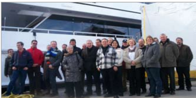
Dwarstuigers die de kou nog even trotseerden voor de foto

grijpelijk dat we helaas geen kijkje op de brug konden nemen. Maar er viel evengoed genoeg te zien zoals b.v. de vrijwel onzichtbaar geïntegreerde zware hydraulische kraan om de tender mee te water te laten. (Zoiets noem je natuurlijk geen bijbootje meer...)