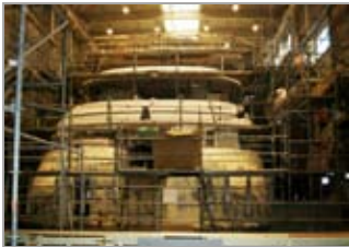
In de hal

Na de verwelcoming met koffie of thee en een welkoms- en introductiepraatje door Ben Boon (manager nieuwe projecten) werden we door hem voorgedaan voor een rondleiding door het bedrijf. We bekeken er 3 schepen: één van 39 m. in de hal, één van 57 m. in het water (op afstand, want hij was al overgedragen aan de eigenaar) en één van 65 m.