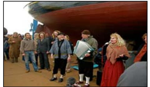
Optreden van 't Scheepsfolk

M et een feestelijk gebeuren; de nodige toespraken, muziek en een overweldigende belangstelling heeft de Stichting Atlantis Zeilende