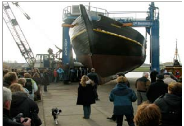
En daar gaat ie dan

Binnenkort komt het schip terug op haar plekje in Willemsoord waar ze wordt afgebouwd en getuigd. En dan zal ze eindelijk het ruime sop kiezen. Met lading!