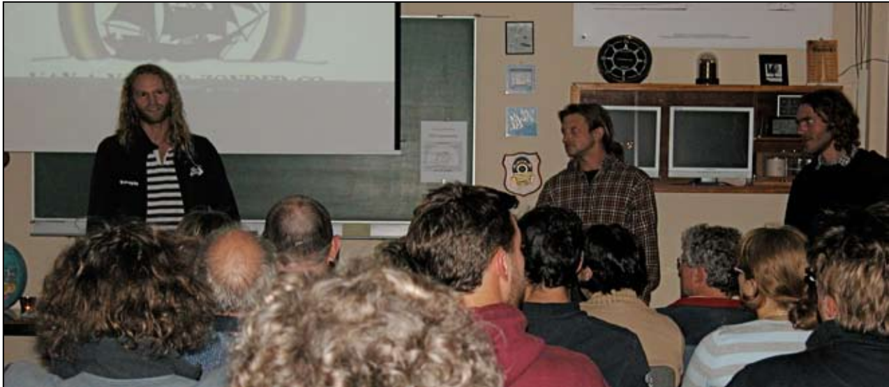
de 'tres hombres' geven een lezing